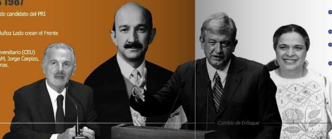
Cambio de Enfoque